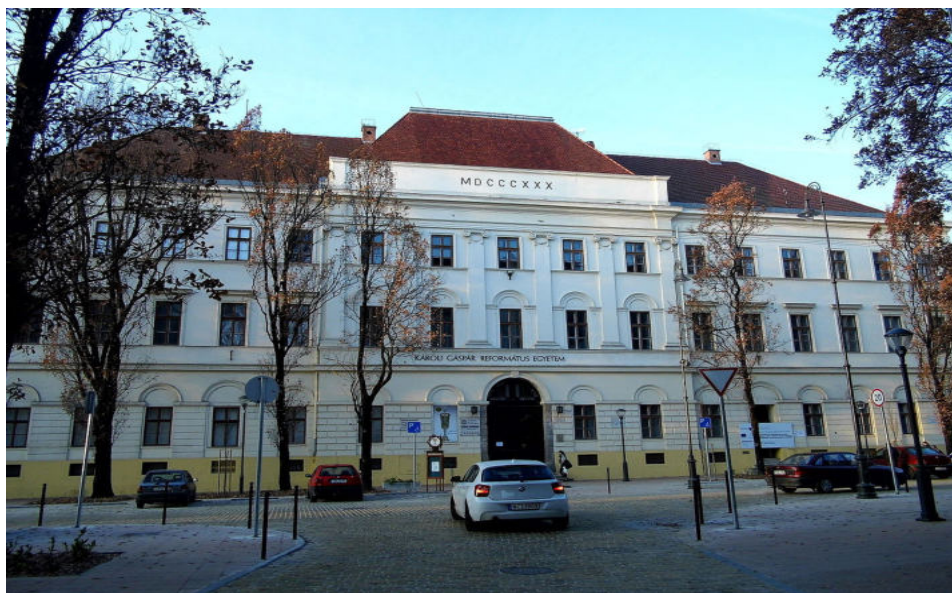
Az Ókollégium épülete