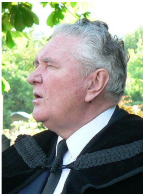
Hegedűs Lóránt református püspök, a Zsinat lelkes elnöke

Hegedűs Lóránt református püspök, a zsinat lelkes elnöke az ünnepélyes tanévnyitó kapcsán mondott igéjében kiemelte: a jog a jónak és a méltányságnak a művészete. Figyelmeztetett arra, hogy nincs jogosság igazság nélkül, de e két fogalom egységét a szeretetnek kell betöltenie. Szólt arról is, hogy Kecskeméten a református egyház jóvoltából 1831-től képeztek jogászokat, az egykori hallgatók soraiban olyan jeles személyiséget is, mint nagy magyar író, Jókai Mór. A nagyhírű intézményt 1948-ban államosították, majd egy év múltán megszüntették.