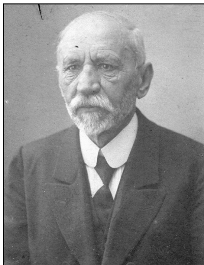
Pálóczi Czinke István (1855–1942)

alakult Tiszáninnen Református Egyházkerületben is beiktatták tisztségébe az újonnan megválasztott püspököt és főgondnokot: Pálóczi Czinke István rimaszombati lelkészt és Lukács Géza gömöri egyházmegyei gondnokot. E két egyházkerület mellé csatlakozott harmadikként a Kárpátaljai Egyházkerület, ahol az 1923. június 7-én lezajlott választások után Bertók Béla munkácsi esperes lett az egyházkerület püspöke, és György Endre nyugalmazott miniszter a főgondnoka. E három egyházkerület közösen alkotta meg a Szlovenszkoí és Kárpátaljai Egyetemes Református Egyházat. Ennek az egyháznak az 1938-as visszacsatolásig nagyon sok harcot kel-