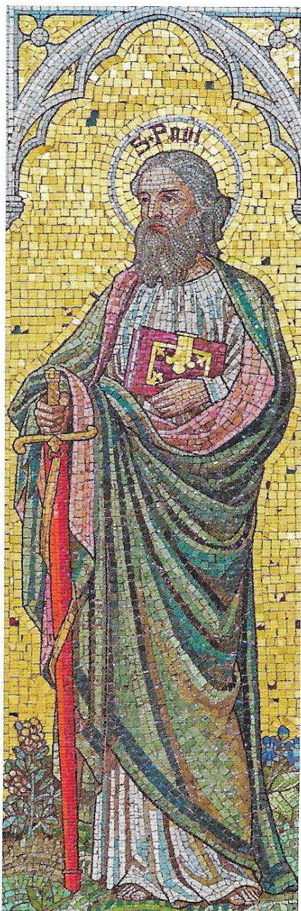
Pál apostol, mozaik, Szent Barnabás templom, 19. század vége, London