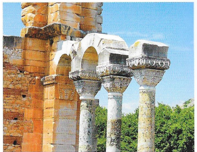
Filippi romjai, Görögország

A filippibeliekhez írt levél (Fil) is fogságból írt levél (1,7.12–17), amelynek ennek ellenére az öröm az alaphangja