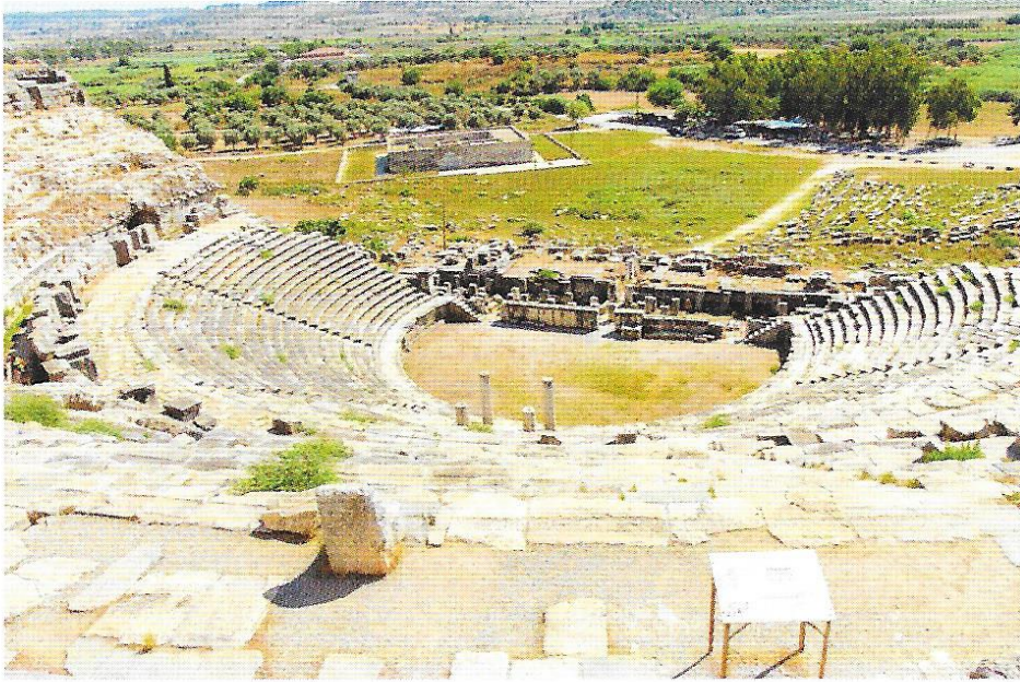
Milétosz, Törökország

utal arra, hogy Pál apostol fogságban lenne, ezért a kutatók szerint az első római fogságából kiszabadulva, újabb missziói útjai során írhatta az apostol e levelet Kr. u. 62–64 között. 17 A Timóteushoz írt második levelet (2Tim) fogságból írta, sőt ekkor már nem számolt a kiszabadulása lehetőségével (2Tim 4,6–8). A kutatók szerint ezért ez már egy második római fogsága lehetett, amely végén az apostol ógyházi hagyomány szerint Nero császár keresztyénüldözése alatt szenvedett mártírhalált. Sok kutató szerint az apostol mártírhalála már a nerói üldözés elejére tehető, ez esetben az apostol még Kr. u. 64 vagy 65 előtt megírta e levelét (nem sokkal halála előtt). 18 Valószínűleg ez Pál apostol utolsó fennmaradt levele.